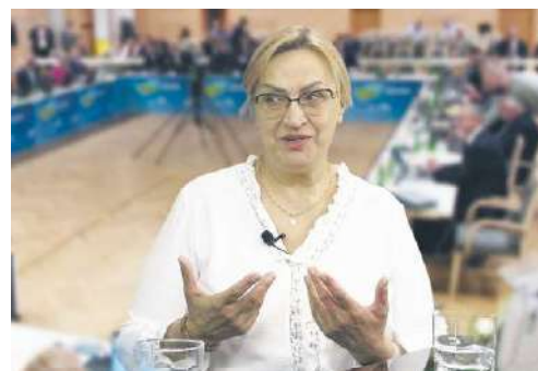
Lubuskie nie jest anonimowe w tej chińskiej prowincji?

Targi to przede wszystkim platforma nawiązywania międzynarodowych kontaktów biznesowych?