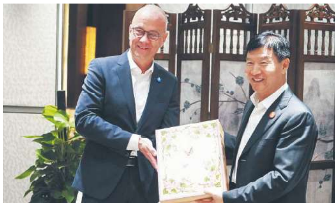
Wspólna przyszłość zaczyna się od rozmowy. I od wzajemnego zaufania